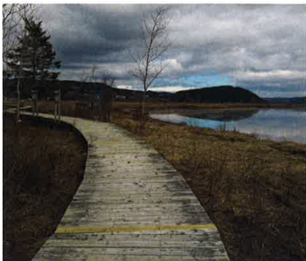
Sentier des battures, Saint-Fulgence